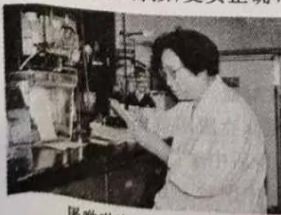
屠呦呦在实验室工作

25. (5 分)请依据下面图片反映的历史信息,并结合所学知识,写一篇 80—120 字的小短文。(要求:题目自拟,史实正确,语句通顺,表述完整,体现图片内容之间的联系性)