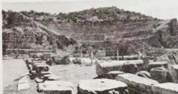
图2 古希腊奥林匹亚竞技场遗址

材料二 中国古代体育教育中武备教育占据重要地位,同时注重保健养生。传统文化对“礼”与“德”的重视,使得中国古代体育活动与伦理道德结下了不解之缘,这也成为中国古代体育发展的重要驱动力。在古希腊,体育教育多以军事为出发点,希望训练出强健的体魄和强悍的战斗能力。其体育文化,是以个性发展、个体生命能力弘扬为主体构建的。健美的人体成为一切文化的中心。在古希腊时期,体育在法律中是明文规定,强制执行的,这主要是由于中西方古代社会的法律秩序不同形成的差异。