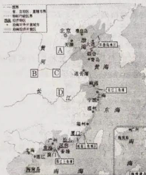
对外开放示意图(局部)

材料二 浦东位于上海,东北濒长江,南临杭州湾,西靠黄浦江,有良好的建港和水运条件。1990年中央宣布开发开放浦东后,上海市提出“不搞特区搞新区,不搞经济技术开发区搞功能开发区。”……在很短的时间内,浦东就成为令世人瞩目的国际经济、金融和贸易中心之一,并极大地推动了长江三角洲和整个长江流域的经济发展。