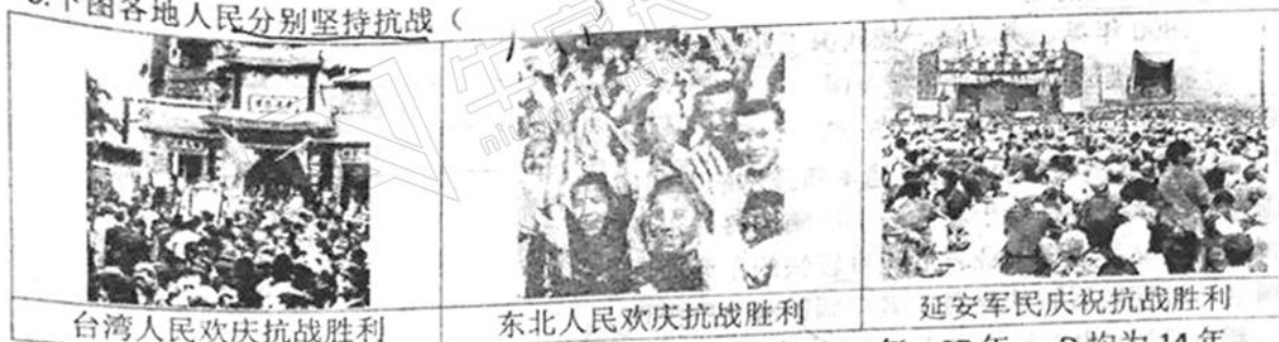
台湾人民欢庆抗战胜利