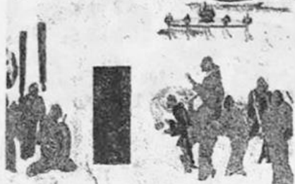
图一：张骞拜别汉武帝