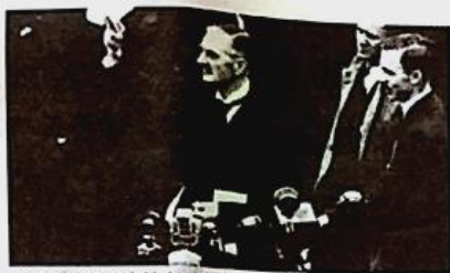
1938年张伯伦从慕尼黑返回，承诺确保了“我们这个时代的和平”。