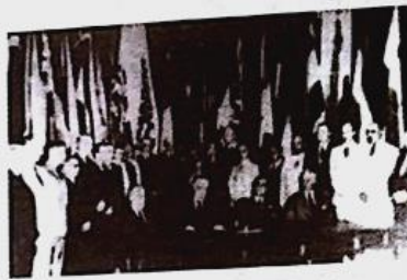
《联合国宣言》签字仪式