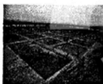
图三 汉魏洛阳城遗址