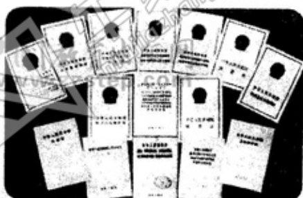
十一届三中全会以来的法律、法规文本