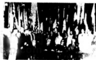
图二 《联合国宣言》签字仪式