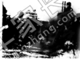
图一 中国守军在卢沟桥抗击日军

25. (5 分) 请依据下面图片反映的历史场景，并结合所学知识，写一篇 80-120 字的小短文。(要求：题目自拟，史实正确，语句通顺，表述完整，体现图片内容之间的联系性。)