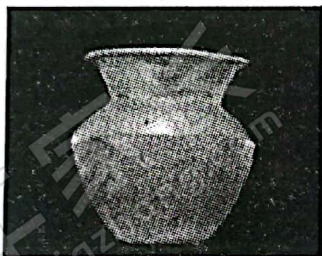
原始瓷尊，商代， 郑州市人民公园商代墓出土