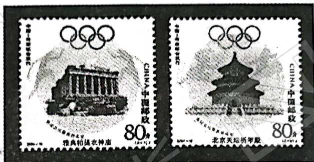
《奥运会从雅典到北京》纪念邮票

材料一 2004 年 8 月,中国和希腊联合发行了《奥运会从雅典到北京》纪念邮票,邮票全套两枚。左图中雅典帕提(特)农神庙是供奉雅典娜女神的主神庙,背景衬图为古希腊瓶画上运动者的形象;右图中北京天坛祈年殿是明清两代皇帝祈福、祭天之所,其设计体现了“敬天礼神”思想,背景衬图采用了南阳汉代画像石上的武士竞技造型。