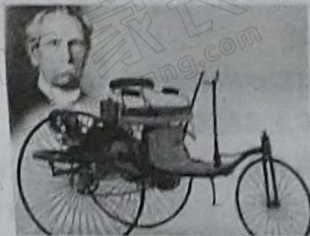
德国人本茨和他发明的汽车

25. (10 分) 请对比下面两幅图片反映的历史信息, 并结合所学知识, 写一篇 80—120 字的小短文(要求: 题目自拟, 史实正确, 语句通顺, 表述完整, 体现两幅图片反映内容的比较)