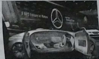
计算机系统控制的无人驾驶奔驰汽车