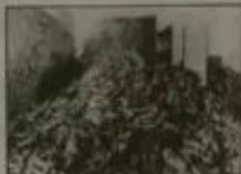
图二 1945年1月27日苏联解放波兰奥斯维辛集中营, 发现被屠杀者留下的鞋子堆积如山。二战中被屠杀的犹太人达600万。