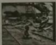
图一 1937年8月28日上海南站儿童。当时车站有1800余人, 被炸死250余人, 炸伤500余人。