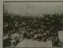
图三 原子弹爆炸后广岛尸横遍野, 一片废墟, 24.5万人中7.8万人当日死亡, 受核辐射残害致死者已近2.0万。

材料二 1996年德国将1月27日定为“纳粹受害者纪念日”, 2005年联合国将该日定为“国际大屠杀纪念日”; 2011年美国总统奥巴马将12月7日定为国家“荣军纪念日”; 2014年2月27日中国确定12月13日为国家公祭日。