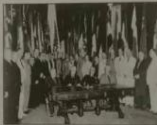
《联合国宣言》签署场面